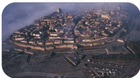
Ciudad Rodrigo, Salamanque

Dans ce guide, nous vous proposons les principaux sites d'intérêt de la ville de Salamanque, sans oublier notre province et ses ressources historiques, naturelles et touristiques.